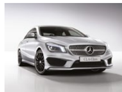
761 Plata Polar