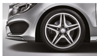
CLA 250 CGI 225/40 R 18