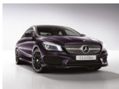
592 Violeta Aurora Boreal