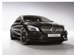
191 Negro Cosmos