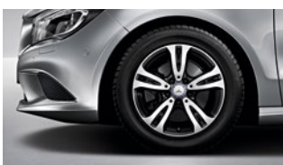
CLA 180 CGI 205/55 R 16

Las llantas son un elemento técnico imprescindible en cualquier vehículo, pero tienen también su importancia a nivel emocional: pocos detalles son tan relevantes como elegir los rines perfectos para su vehículo soñado. De ahí que hayamos preparado un elenco variado y atractivo para usted.