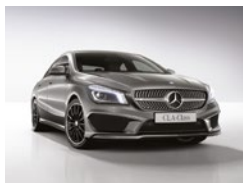
787 Gris Montaña