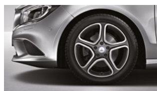
CLA 200 CGI 225/45 R 17