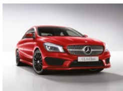
589 Rojo Júpiter