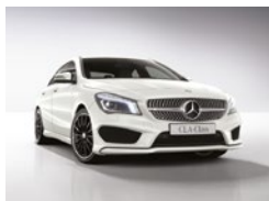
650 Blanco Cirro