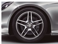
E 400 CGI Sport Delante 245/40 R 18 Detrás 265/35 R 18