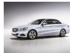
988 Plata Diamante