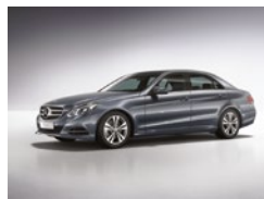
755 Gris Tenorita