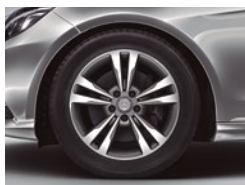
E 200 CGI Avantgarde 245/45 R 17

Las llantas son un elemento técnico imprescindible en cualquier vehículo, pero tienen también su importancia a nivel emocional: pocos detalles son tan relevantes como elegir los rines perfectos para su vehículo soñado. De ahí que hayamos preparado un elenco variado y atractivo para usted.