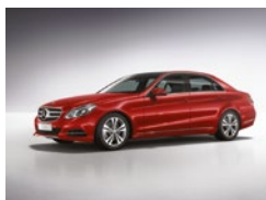
966 Rojo Jacinto