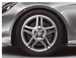
E 500 CGI Biturbo Delante 245/40 R 18 Detrás 265/35 R 18