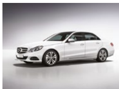
149 Blanco Polar