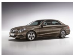
526 Marrón Dolomita