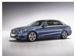
585 Azul Covelina