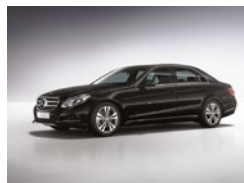
197 Negro Obsidiana