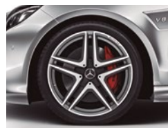
E 63 AMG Biturbo Delante 285/30 R 19 Detrás 285/30 R 19