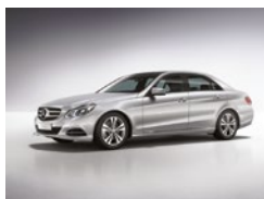
792 Plata Paladio