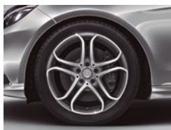
E 250 CGI Avantgarde Delante 245/40 R 18 Detrás 265/35 R 18