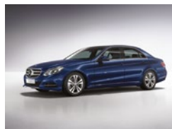
890 Azul Cavansita