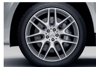
Mercedes-AMG GLS 63 295/40 R 21