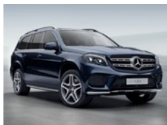
890 Azul Cavansita