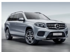
988 Plata Diamante