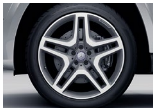
GLS 500 Biturbo 295/40 R 21

Las llantas son un elemento técnico imprescindible en cualquier vehículo, pero tienen también su importancia a nivel emocional: pocos detalles son tan relevantes como elegir los rines perfectos para su vehículo soñado.