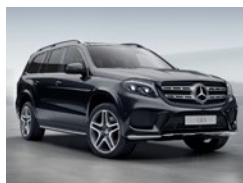
197 Negro Obsidiana