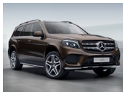
796 Marrón Citrina